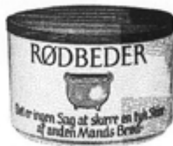
Nr. 667 Krukke m. låg nr. 4 Rødbeder nr. 13 Sild nr. 14 Agurkesalat