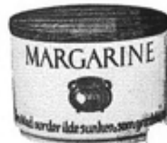
Nr. 670 Krukke m. låg nr. 49 Margarine