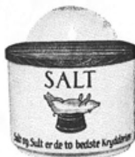
Nr. 614 Kar m. låg nr. 8 Salt nr. 9 Mel nr. 10 Sukker