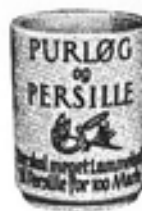
Nr. 665 Bæger nr. 40 Purløg/Persille nr. 65 Dild