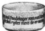
Nr. 673 Kabaretskål/Fondueskål nr. 51 nr. 54 nr. 52 nr. 55 nr. 53 nr. 56