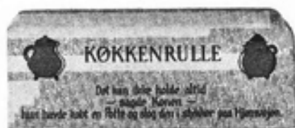
Nr. 660 Køkkenrulleholder nr. 58