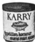
r. 666 Krukke m. låg r. 25 Sennep r. 26 Paprika r. 27 Karry r. 28 Kanel r. 29 Peber r. 30 Vanille r. 31 Nelliker r. 33 Kardemom. r. 34 Allehånde