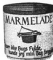
Nr. 664 Krukke m. låg nr. 5 Marmelade nr. 6 Syltetøj nr. 7 Pickles