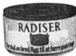
Nr. 668 Krukke m. låg nr. 12 Smør nr. 15 Radiser nr. 16 Fedt