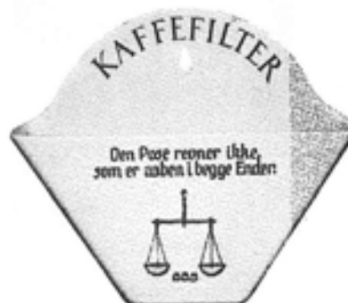
Nr. 676 Kaffefilterholder nr. 46