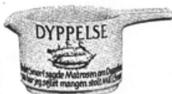
Nr. 612 Smørsmelter nr. 50