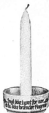
Nr. 571 Lysæstige nr. 48