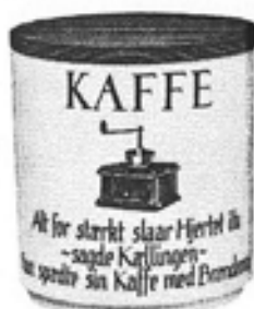
Nr. 613 Krukke m. låg nr. 21 Kaffe nr. 22 The nr. 36 Kakao